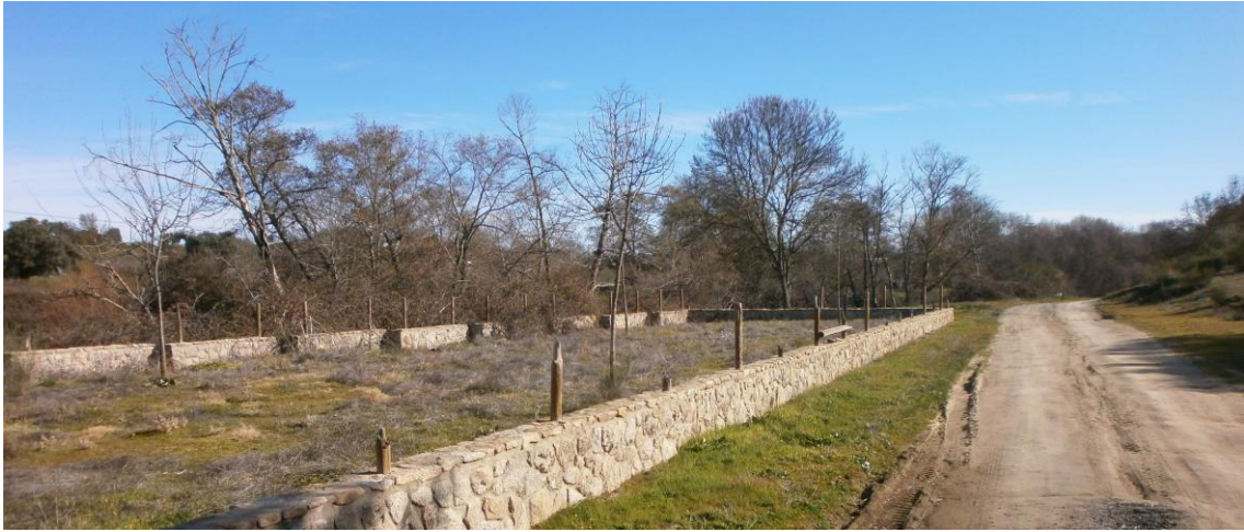
Merendero de la piscina natural

Desde la piscina natural, continuamos por el camino aguas abajo que nos lleva hasta una antigua Aceña.