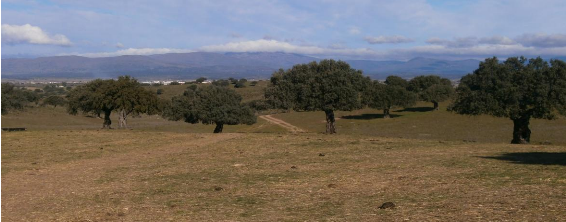
Dehesa de Casas de Don Gómez

Desde esta portera, pasamos por debajo de la autovía hasta llegar a las piscinas naturales.