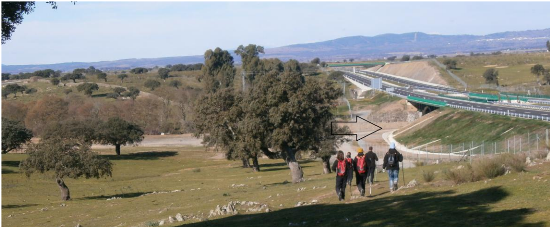
Portera y paso por debajo de la autovía que une Coria y Moraleja

Desde esta portera, pasamos por debajo de la autovía hasta llegar a las piscinas naturales.