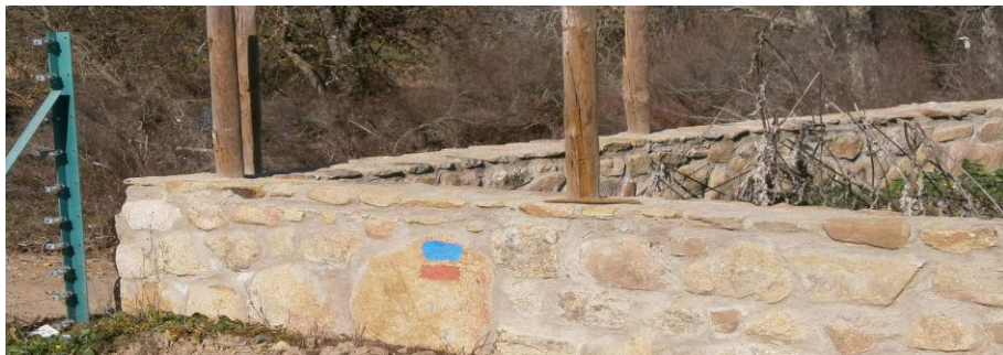
Señalización de la ruta

La ruta esta modificada en las proximidades del Río Árrago debido a las obras de la autovía.