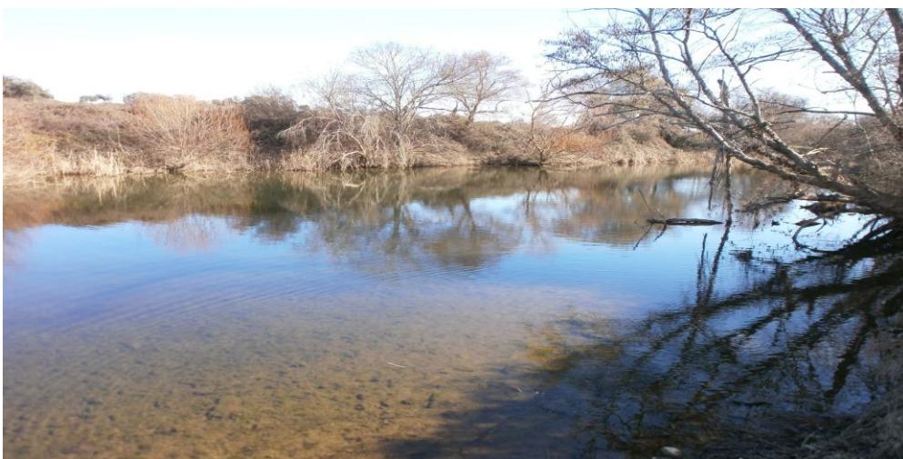
Piscina natural del Río Árrago

Actualmente las piscinas naturales no se encuentran en buen estado y el paso de la autovía ha roto la fisionomía del entorno.