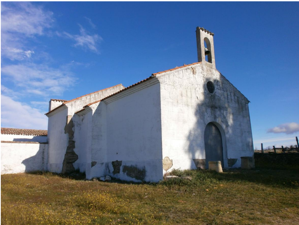
Ermita del Cristo

DESCRIPCIÓN: La ruta parte desde la Ermita del Cristo, con dirección al río Árrago.