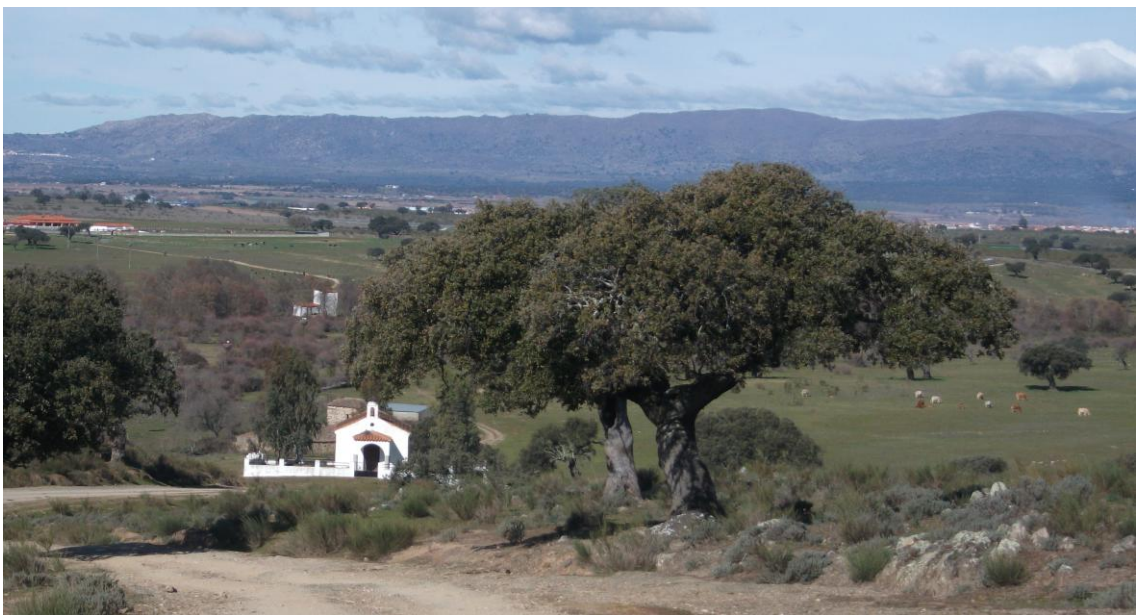
Ermita de San Marcos

A pocos metros nos encontramos con la Ermita de San Marcos.