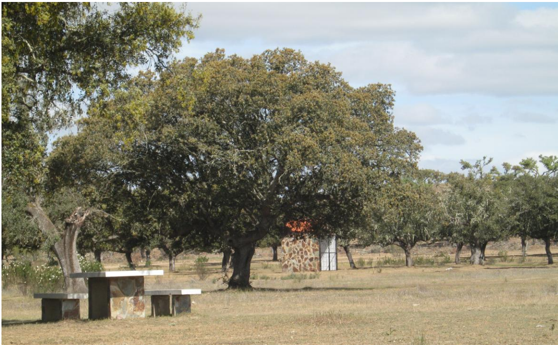
Merenderos Rivera de Fresnedosa

Ahí nos encontramos los Merenderos para poder hacer un descanso en el trayecto.