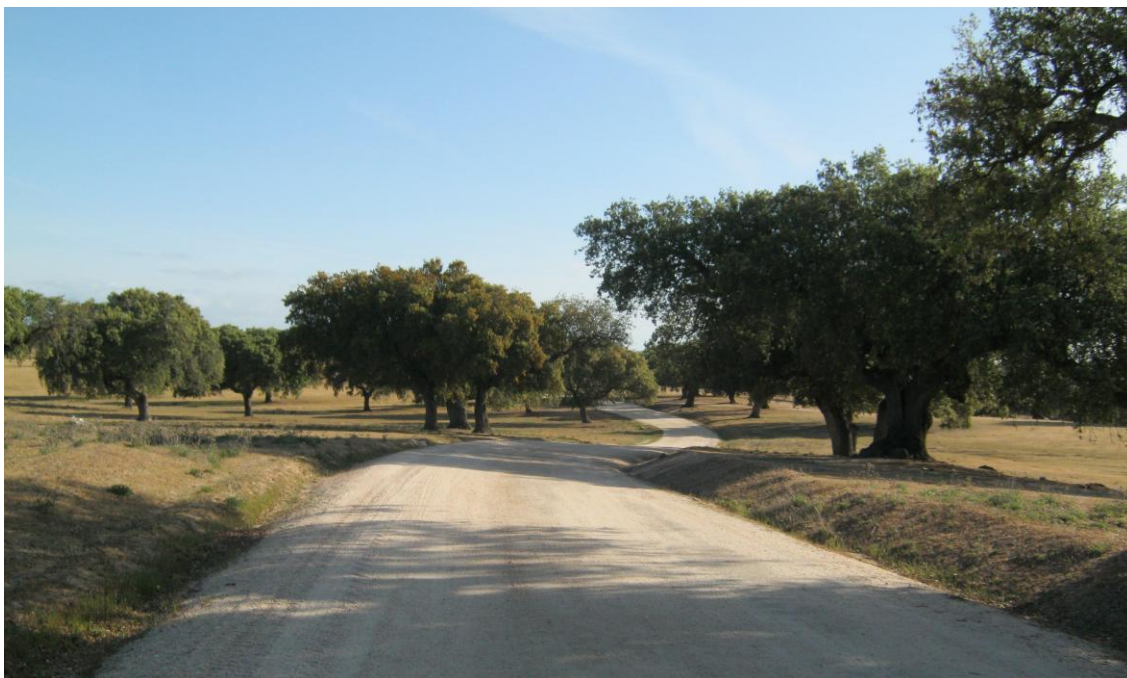
Camino de Pescueza

DESCRIPCIÓN: La ruta parte desde el Polideportivo “Fernando Morientes” de Acehúche, continúa por el Camino de la Laguna del Mayo, dejando a la derecha el Camino de Coria y el Camino del Alberio, para coger el Camino de Pescueza.