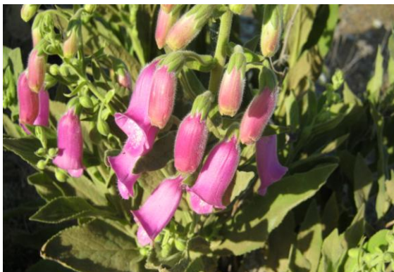
Dedalera (Digitalis purpurea)

En las proximidades de la Rivera de Fresnedosa nos encontramos con vegetación de rivera donde destacamos la tamuja y los sauces.