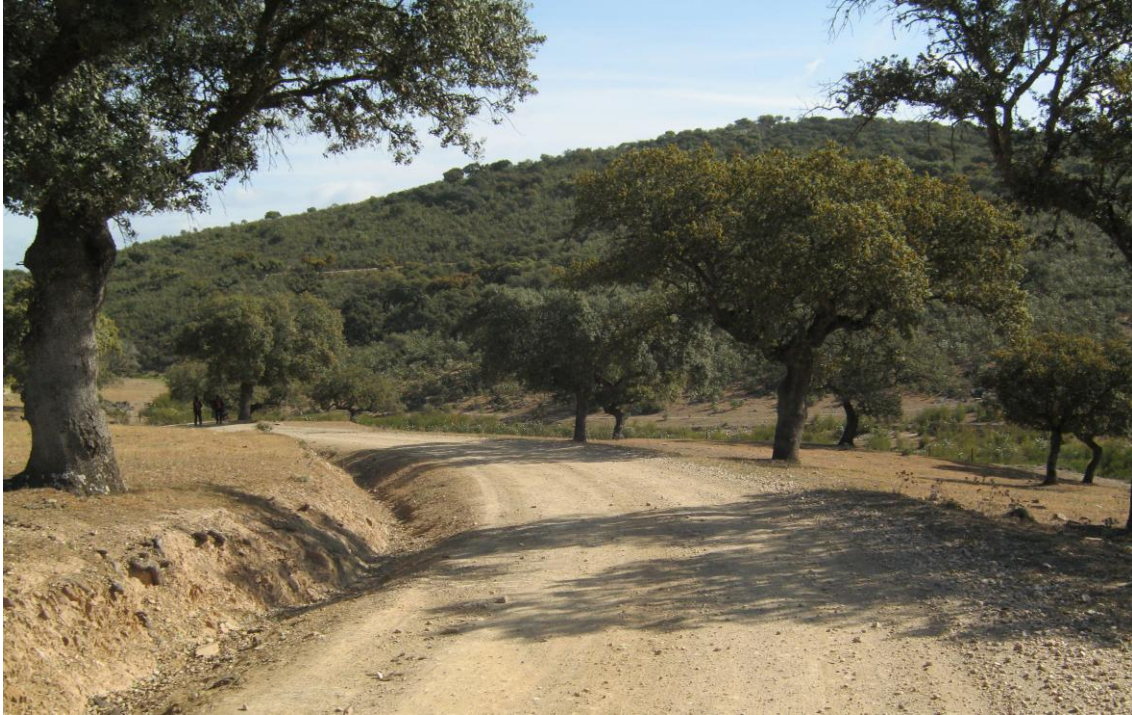
Camino de los Charcos

Ahí nos encontramos los Merenderos para poder hacer un descanso en el trayecto.