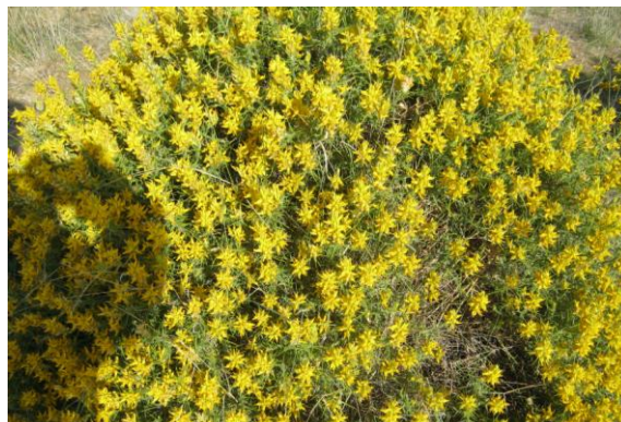
Aulaga (Genista hirsuta)

SUGERENCIAS: Durante la ruta nos vamos a encontrar un Merendero al lado de la Rivera donde poder descansar y contemplar el paisaje que caracteriza a nuestra comarca.