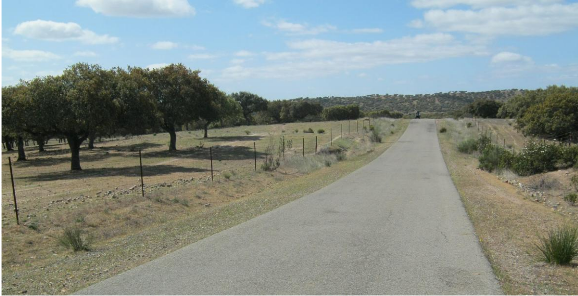
Pista del Arenal

Llegando al final de la ruta, en las proximidades de Pescueza, nos encontramos con una Planta Fotovoltaica, que aunque crea un impacto visual negativo para el Medio Ambiente se trata de un tipo de energía renovable.