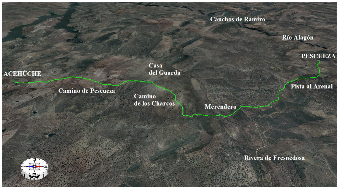
Mapa ruta Sierra de Ladronera