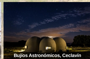
Bujíos Astronómicos, Ceclavín

Financiado por el Programa de Colaboración Económica Municipal de Orientación y Prospección para el Desarrollo Local