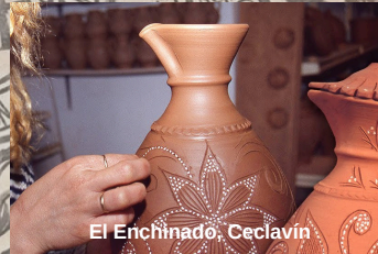
El Enchinado, Ceclavín