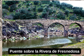
Puente sobre la Rivera de Fresnedosa