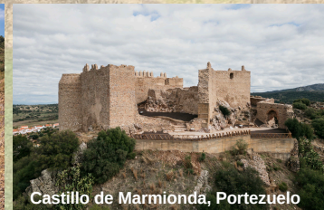
Castillo de Marmionda, Portezuelo