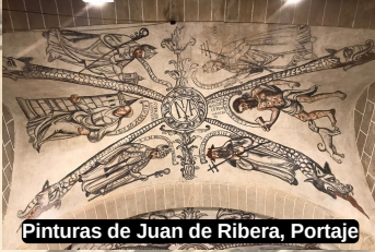
Pinturas de Juan de Ribera, Portaje