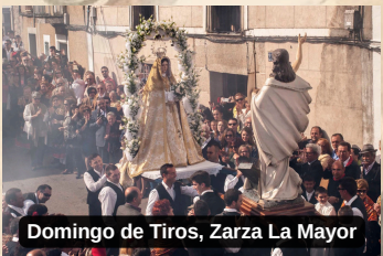
Domingo de Tiros, Zarza La Mayor