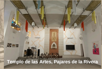
Templo de las Artes, Pajares de la Rivera