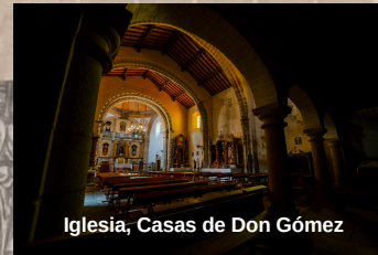
Iglesia, Casas de Don Gómez