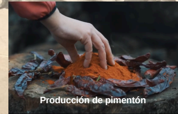
Producción de pimentón