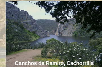
Canchos de Ramiro, Cachorrilla

¡Paisajes y emociones que conectan contigo!