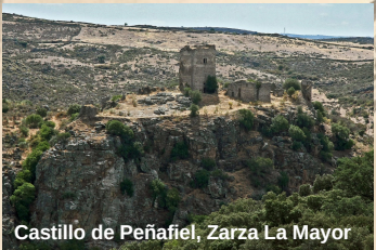
Castillo de Peñafiel, Zarza La Mayor