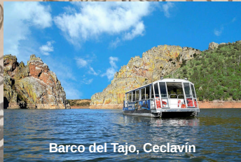
Barco del Tajo, Ceclavín