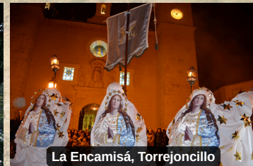
La Encamisá, Torrejuncillo