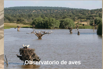
Observatorio de aves