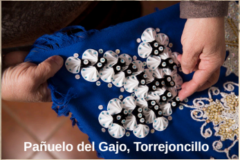
Pañuelo del Gajo, Torrejoncillo