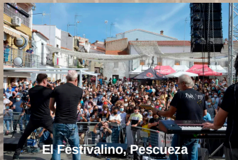
El Festivalino, Pescueza