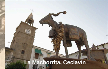
La Machorrita, Ceclavín