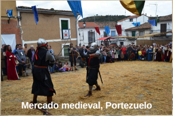
Mercado medieval, Portezuelo