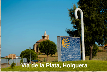
Vía de la Plata, Holguera