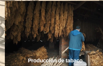
Producción de tabaco