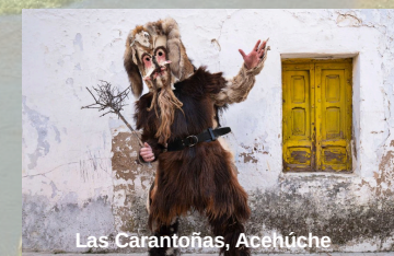
Las Carantoñas, Acehúche