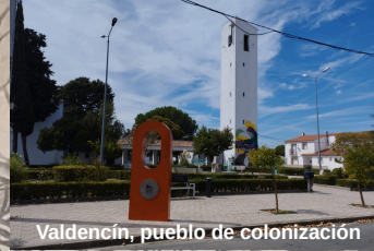
Valdencín, pueblo de colonización