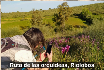
Ruta de las orquídeas, Riobos