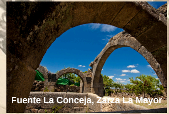
Fuente La Conceja, Zarza La Mayor