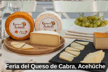
Feria del Queso de Cabra, Acehúche