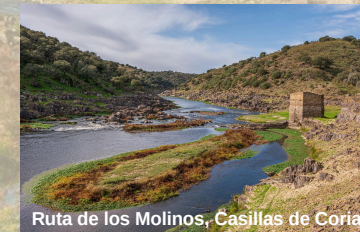
Ruta de los Molinos, Casillas de Coria